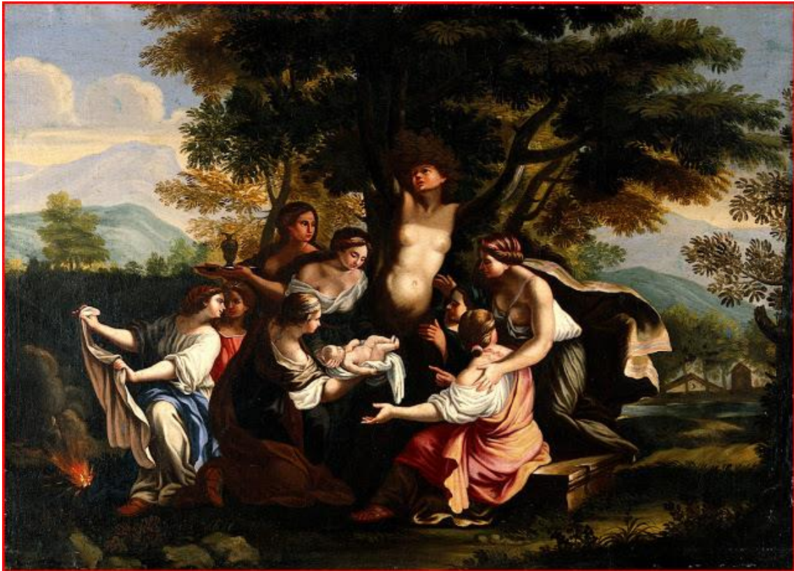
Adonis nace de un Árbol de Mirra y muere transformado en Flor.

Las plantas también podían y pueden ayudarnos a contactar con la paciencia, la tranquilidad, la armonía, el amor, el miedo, la inspiración, el deseo (P. E La Ninfa Mintha o Menta despertó el deseo en Hades y con ello, los Celos de Perséfone y de la mismísima Hera y posteriormente la compasión y arrepentimiento de Hades ). A veces estos Dioses y estas Diosas también llegaban a castigar, manipular... (P.E Hades dio a Perséfone semillas de granada para quedar vinculado a ella, sin ella ser consciente del momento en que ese contrato se realizaba de por vida, perdurando hoy en día y noche)