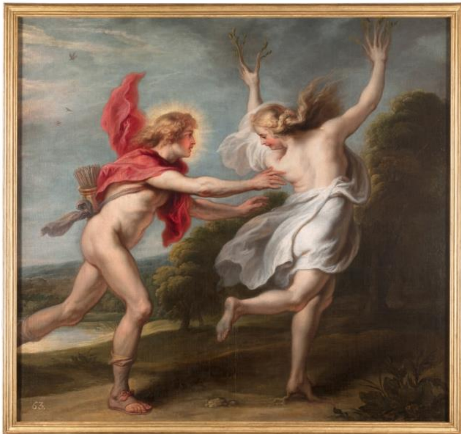
Apolo corre tras Dafne y ella termina convertida en Laurel.

La Dama de Amboto (Para algunos Pachamama , Hera para los Griegos...) deja la Albahaca a una pareja de jóvenes ( Lon y Edurne ) que van a tener un hijo. La muchacha está enferma a causa de un frío invierno y la Albahaca le aporta lo que necesita Edurne para sanar.